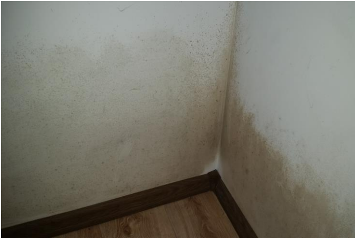
Fragment pomieszczenia przed nałożeniem AERO-THERM

KAMIENICA W ZABUDOWIE CIĄGŁEJ W BRUKSELI. AERO-THERM ZASTOSOWANO DO OCIEPLENIA MIESZKANIA NA PODDASZU, W KTÓRYM BYŁY SPORE PROBLEMY Z KONDENSACJĄ WODY NA ŚCIANACH I Z PLEŚNIĄ. PIERWSZA APLIKACJA - JESIEŃ 2013 ROKU.